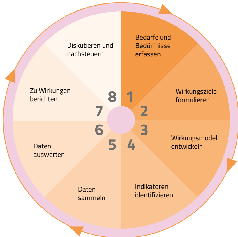
Abb. 2: Kreislauf für wirkungsorientierte Steuerung